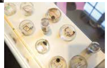
Sonderausstellung: Gegenstände, die von Kindern verschluckt und im UKE ans Tageslicht geholt wurden