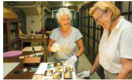
Das Museum beherbergt auch eine große Anzahl an alten Röntgenaufnahmen

Der kleine Sektionsaal wurde nach Originalplänen restauriert und erstrahlt heute in neuem Glanz