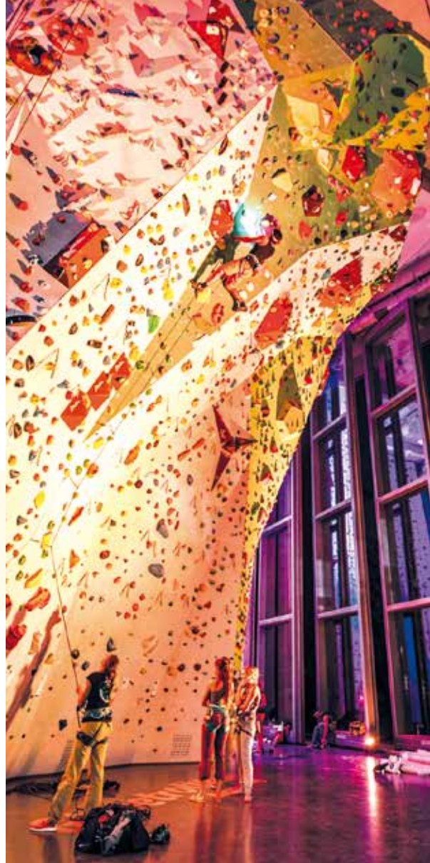
In der Nordwandhalle klettern UKE-Mitarbeiterinnen und -Mitarbeiter zu vergünstigten Konditionen

Wer schon immer einmal auf einem Board über Alster oder Elbe paddeln wollte, wird jetzt bei Apex, Lippmannstraße 57–59, fündig. Hier erhalten UKE-Mitarbeiter 20 Prozent Rabatt auf die Tagesmiete eines Stand-up-Paddel-Boards.