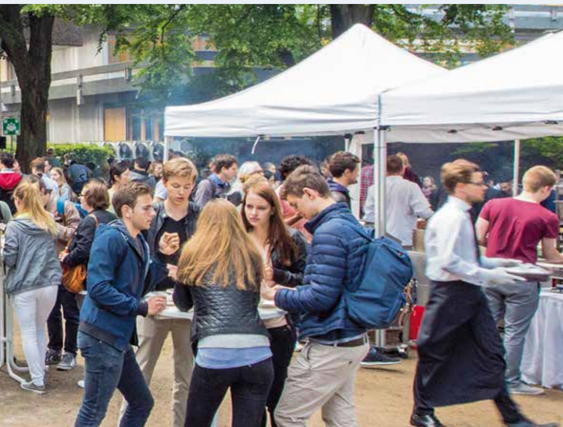
Das Sommerfest vor dem Campus Lehre schweißt Mentoren und Mentees noch enger zusammen

„Sie kümmern sich um Ihr Studium. Wir kümmern uns um Sie.“ Mit diesem Slogan bewirbt die Fakultät das Mentoringprogramm für Studierende. „Mit seinem differenzierten, drei Säulen umfassenden An-