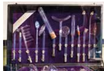
Das Museum zeigt, mit welchen medizinischen Instrumenten Menschen früher behandelt wurden