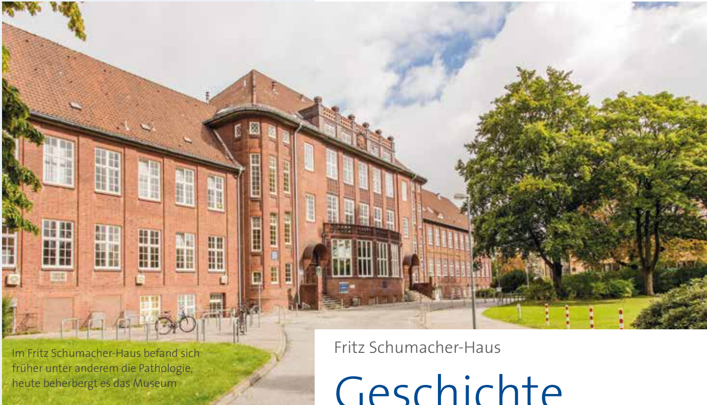
Im Fritz Schumacher-Haus befand sich früher unter anderem die Pathologie, heute beherbergt es das Museum